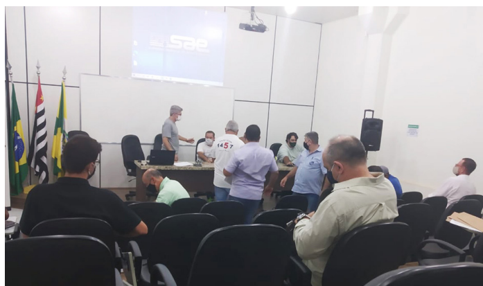
Acompanhando as licitações na SAE