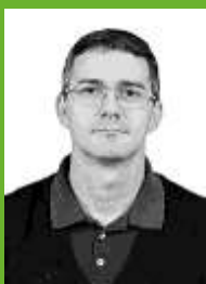
CACHONI 12212 Vereador – PDT