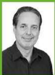
PERINO 43123 Vereador – PV