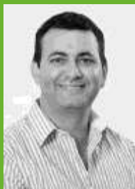
RONALDINHO 15123 Vereador – PMDB-PP